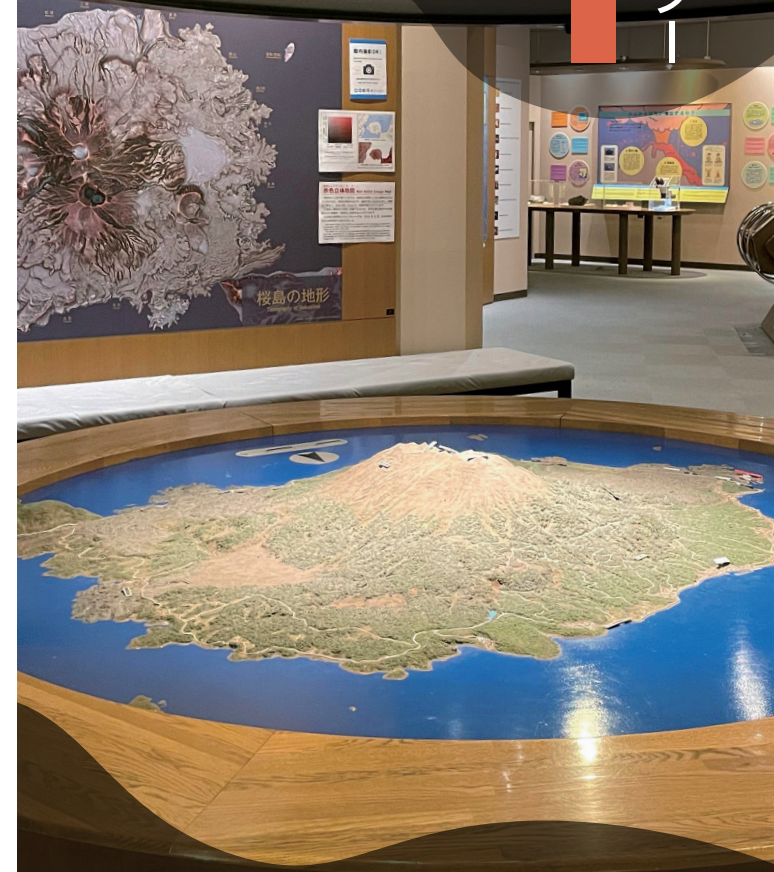
Mini-museum with explanations and displays of Sakurajima's history and geology