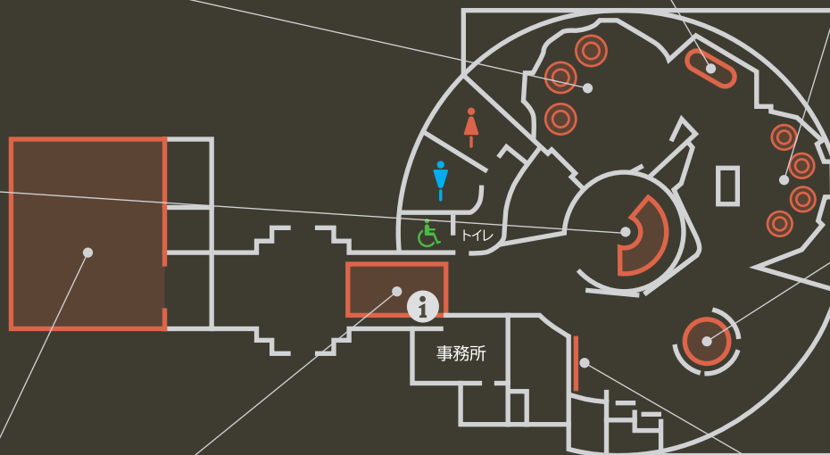
施設紹介 Museum Map

In case you are out of time, or you can't see the mountain because of the weather.