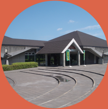
桜島ビジターセンターとは Sakurajima Visitor Center